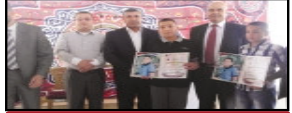
أبو زنيد يشارك في تكريم طلبة مدرسة إمريش