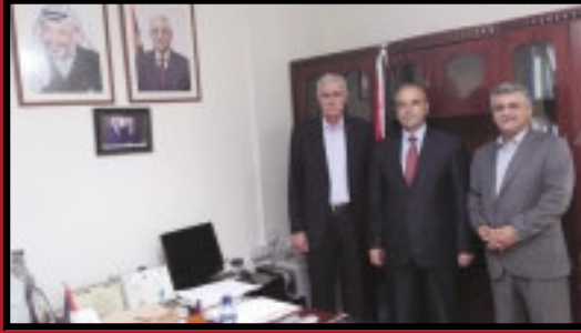
رئيس الديوان يستقبل اللواء الحاج اسماعيل جبر .