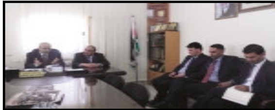
وفد من ديوان الرقابة يزور مديرية تربية جنوب الخليل